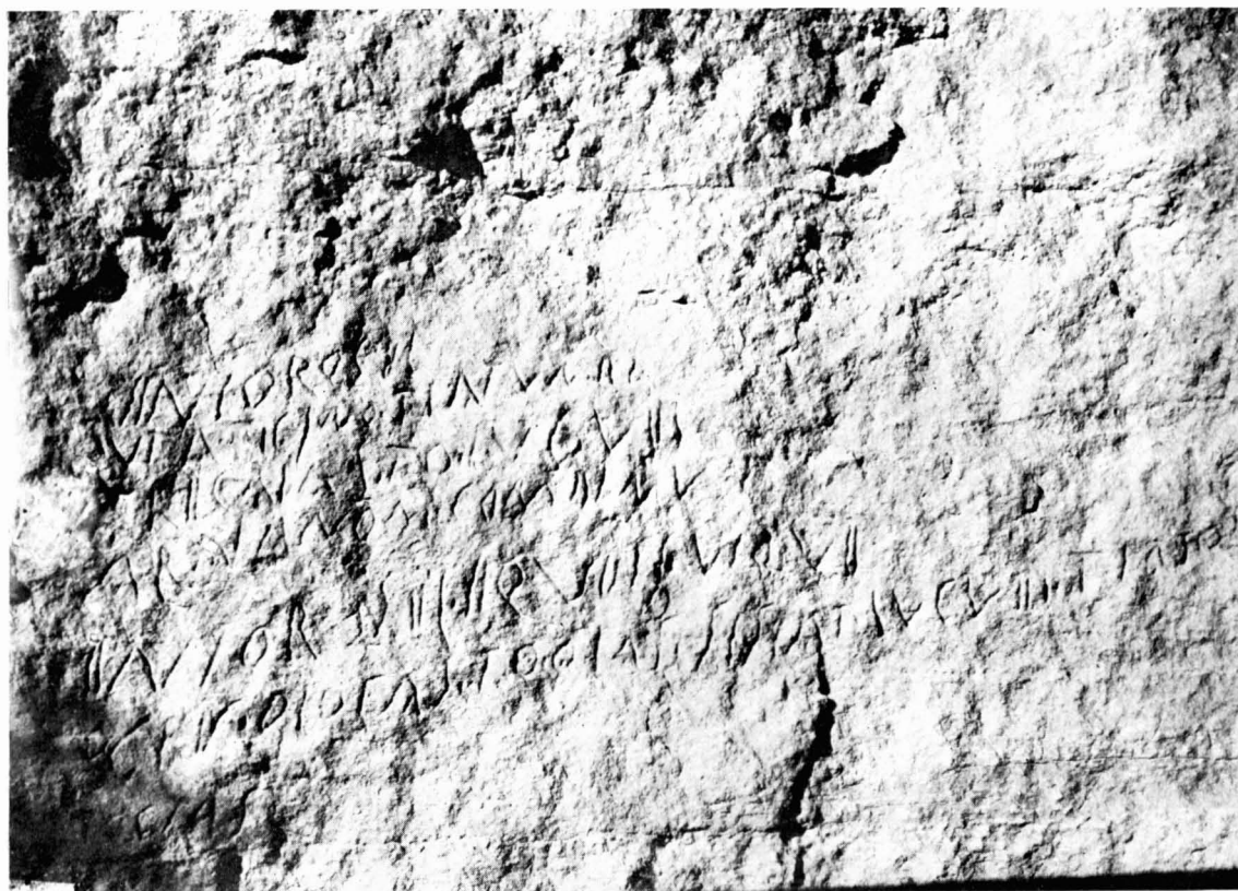
Fotografía de la inscripción in situ .